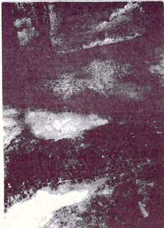
Mosaic de tesselles. Sant Valentí de les Cabanyes

Remarquem també la presència de pintures murals a l'antiga entrada de la basílica de Santa Maria de Vilafranca del Penedès, troballa efectuada, igual com a Sant Valentí, l'any 1973 (9).