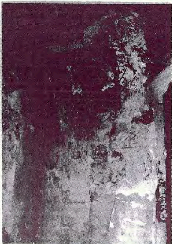
Figures de sants. Sant Valentí de les Cabanyes

Resulta impossible a un modest afeccionat a l'art romànic, de precisar dades sobre l'antigor